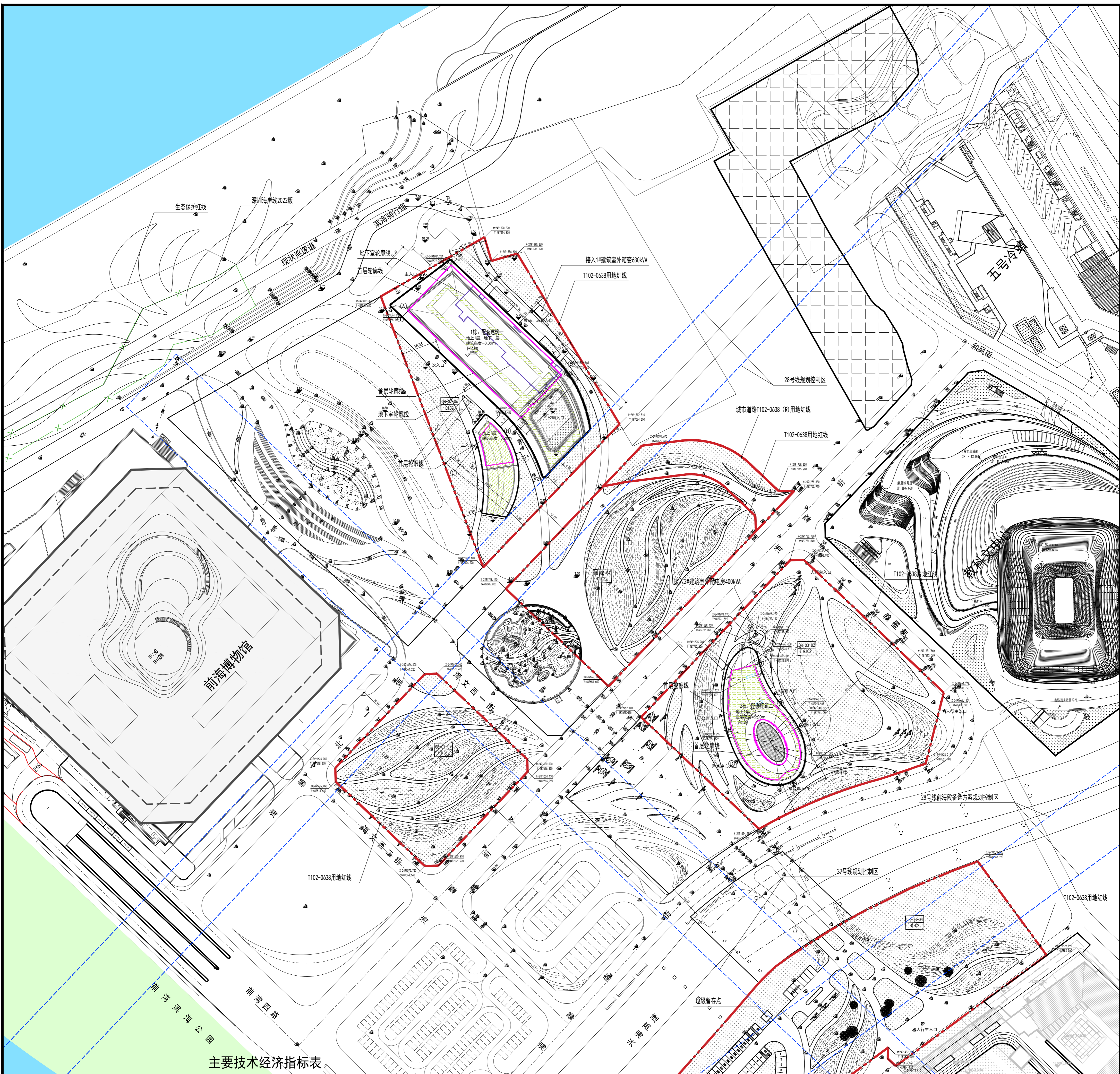
主要技术经济指标表