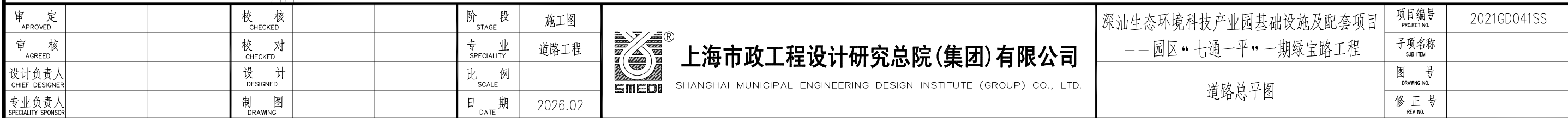
图例：——绿宝路总平面图

深汕生态环境科技产业园基础设施及配套项目 ——园区“七通一平”一期绿宝路工程 道路总平面图