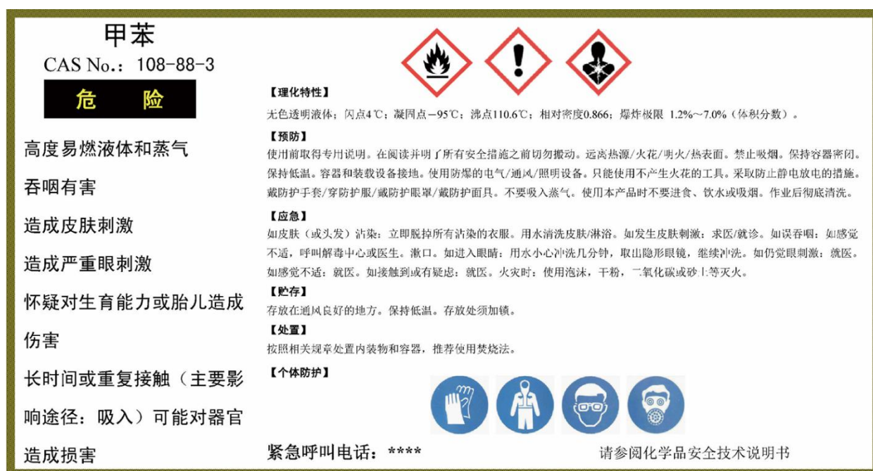
图 3 安全信息告知牌（示例）

9.3.2 实验室、危险化学品储存场所应建立危险化学品清单，并备有相应化学品安全技术说明书。可结合现场实际增设危险化学品安全周知卡。危险化学品安全周知卡示例见图 4。