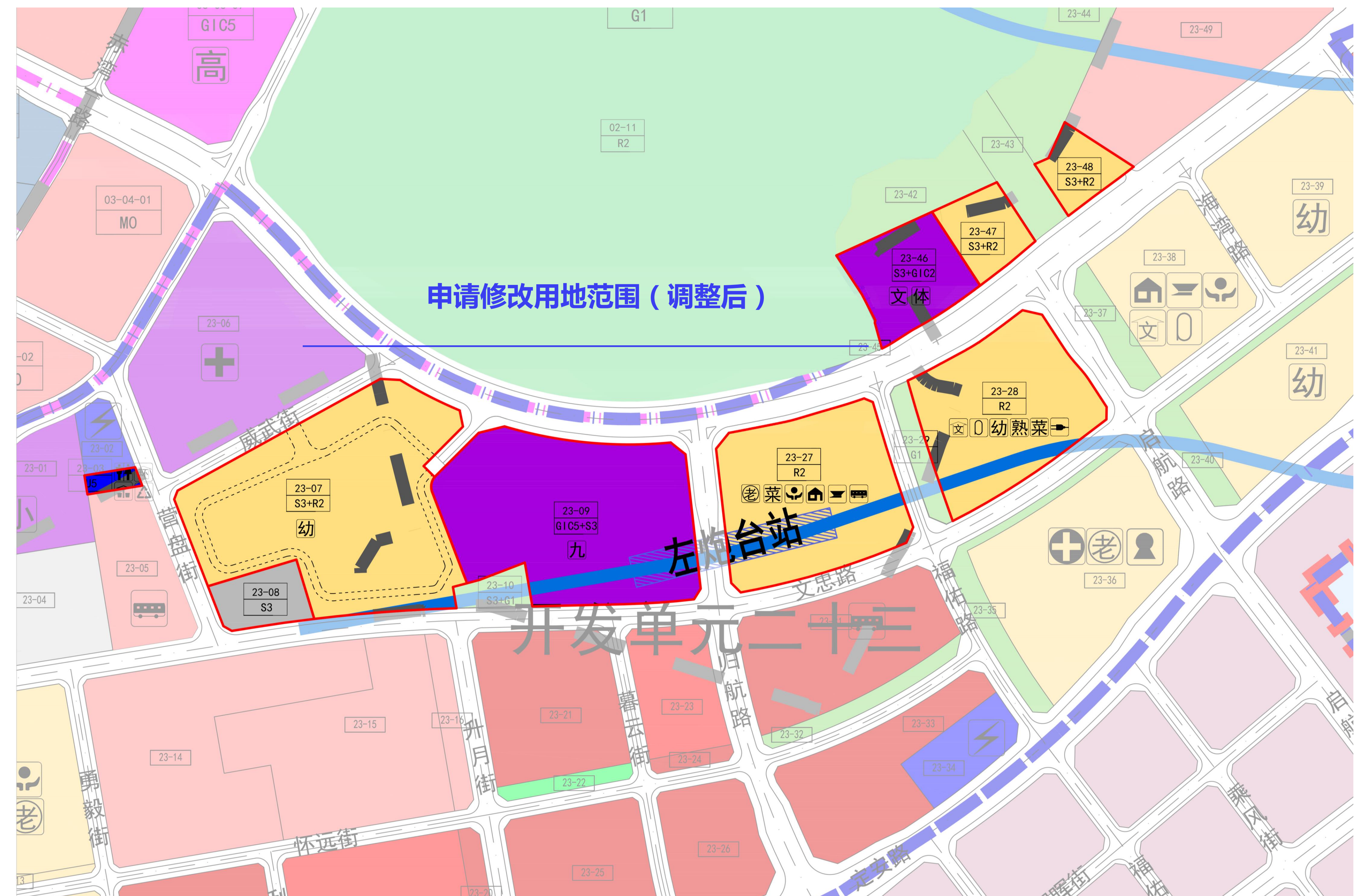
地块控制指标一览表（调整后）